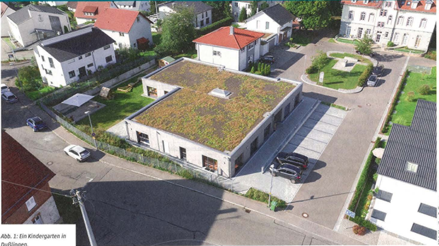
Abb. 1: Ein Kindergarten in Dußlingen.