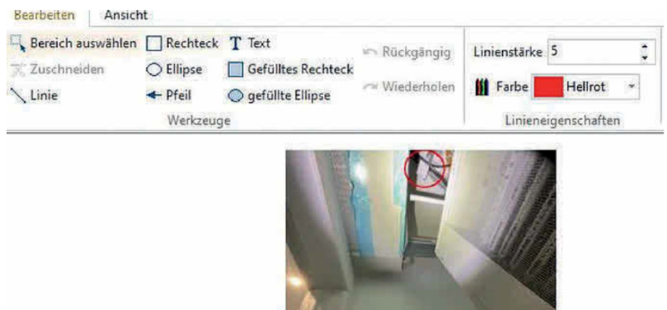
Integrierte Bildbearbeitungsfunktionen ermöglichen einfache Bildkorrekturen oder Hinweise und Anmerkungen direkt im Bild.

Baustellenaktivitäten und Mängel zu dokumentieren ist mühsam und aufwendig. Vor Einführung der Programme Bautagebuch und Bildverortung von Weise Software wurde im Planungsbüro IBE Mahnke & Schaarschmidt alles händisch erledigt: Baustellenfotos gesichtet, sortiert, in Worddokumente eingefügt, formatiert und beschriftet, wobei die Zuordnung der Bilder insbesondere bei Großprojekten eine Herausforderung war. Auch der Kamerastandort ließ sich nicht ohne weiteres zuordnen. Für Daniel Schaarschmidt, beratender Ingenieur VBI und Fachplaner für vorbeugenden Brandschutz, Grund genug, die Baudokumentation seines Ingenieurbüros zu digitalisieren und die Baustellenfotos noch vor Ort im Grundriss zu verorten. Der Nachbereitungsaufwand im Büro ist dadurch gesunken und auch die Vorbereitung von Baubegehungen wurde einfacher: Im Büro legt der Fachingenieur die Kontrollpunkte samt Hinweisen fest und ein Mitarbeiter vor Ort führt die Kontrolle durch. Seither hat sich das Qualitätsmanagement deutlich verbessert. „Die ausführenden Gewerke bemerken schnell die Genauigkeit und Konsequenz unserer Dokumentation und verhalten sich entsprechend“, meint Schaarschmidt. Inzwischen nutzen fünf Mitarbeiter aus der Planung und Bauüberwachung das